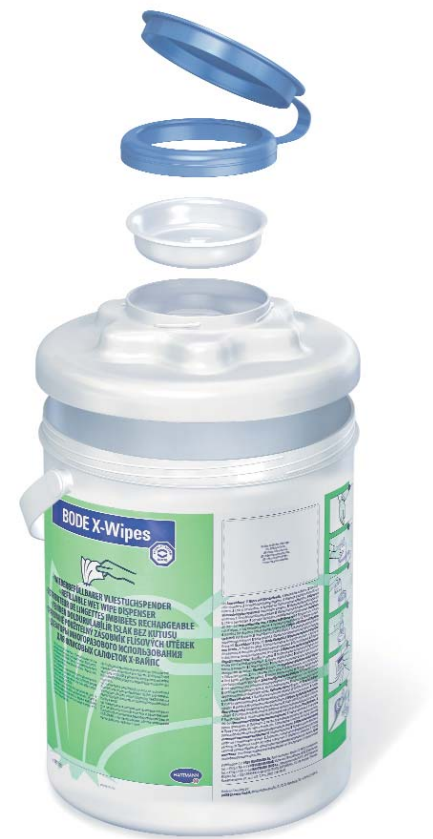
3-teiliges Deckelsystem sowie Spendergehäuse für einfache und sichere Aufbereitung